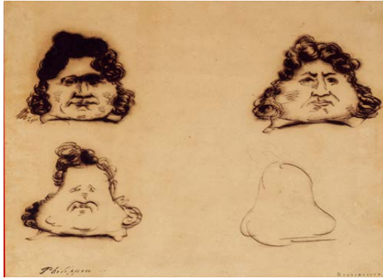
Les poires, illustration d'Honoré Daumier parue dans le journal La Caricature , 1831

La métamorphose du roi Louis-Philippe en poire par Daumier, c'est amusant ou irrespectueux ? Aurait-il fallu interdire d'après toi cette caricature du roi ?