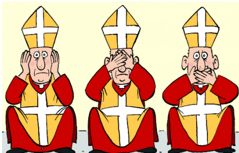
Garnotte, Le Devoir, publié le 6 avril 2010

https://www.france24.com/fr/20200522-l-actu-en-dessin-l-hydroxychloroquine-donald-trump-et-le-professeur-raoult