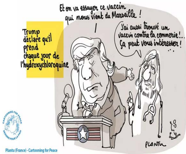
Dr. Donald and Mr. Trump - Plantu (France), Le Monde et Publié sur France 24 le : 22/05/2020

https://www.france24.com/fr/20200522-l-actu-en-dessin-l-hydroxychloroquine-donald-trump-et-le-professeur-raoult