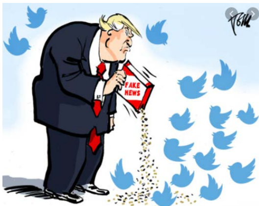
Tom Janssen, The Netherlands. Herald courier . Dec 3, 2017 Updated Apr 17, 2019