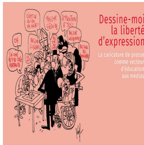
Pierre Kroll. Les dossiers de l'éducation aux médias. Média animation 2017. www.media.animation.be

https://www.courrierinternational.com/article/culture-la-liberte-d-expression-selon-umberto-eco