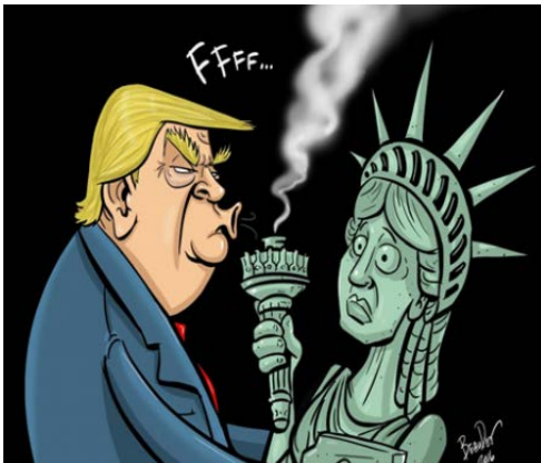
Donald Trump, the new face of the USA - Beudet (Canada)